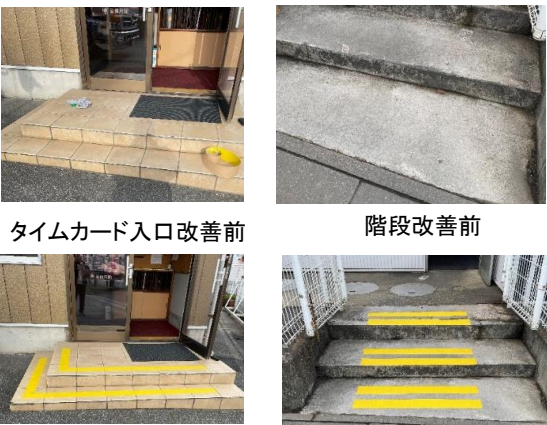
タイムカード入口改善前