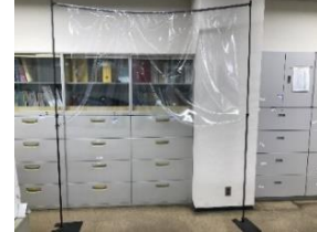
従来はパイプ仕様