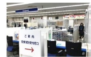
寄贈品の使用風景